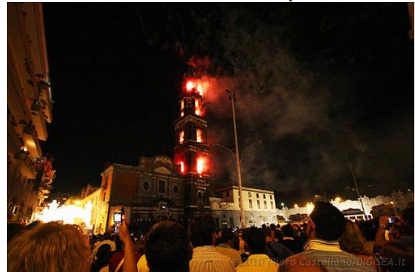
(L'incendio del campanile del Carmine)

Altra festa che un tempo aveva una grande risonanza era quella della Madonna del Carmine che culminava nel suggestivo simulacro dell'incendio del campanile.